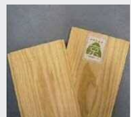
「みやこ杉木」認証マーク