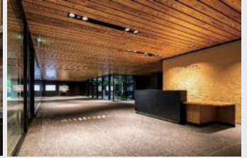
市役所分庁舎(木質化)