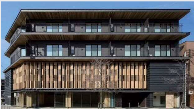
京都木材協同組合の社屋(木造)外観