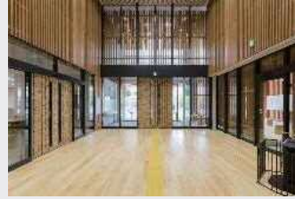
上下水道局太秦庁舎(木質化)

また、令和元年12月末にオープンした全国チェーンの飲食店の店舗（西京区）では、外壁装飾に木材を使用し、市街地景観と調和した外観を形成されています。