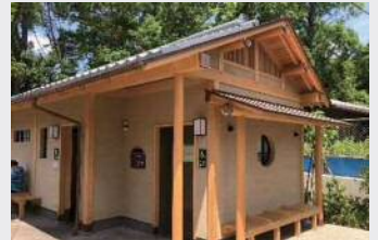
円山公園便所棟(木造)

本市では、これら非住宅施設での木材利用を一層促進し、京都らしい木にあふれたまちづくりを進めるため、令和2年度より、みやこ杉木を非住宅施設で使用される方へ補助制度（市内産木材を使った京のまちなみ推進事業）を創設しました。