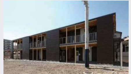
向島秀蓮小中学校・クラブハウス棟(木造)