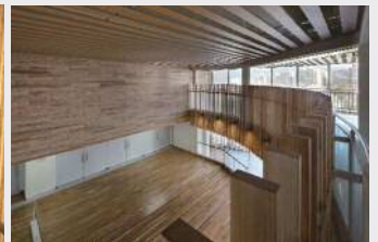
向島秀蓮小中学校(木質化)