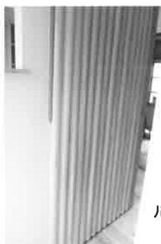
ルーバー / タルキ 北山杉