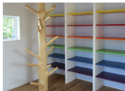
住宅展示場・子ども部屋：枝付き丸太（桧）