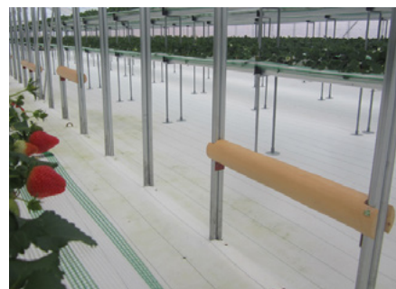
いちご狩り畑・ビニールハウス内の腰掛： 磨丸太（北山杉）