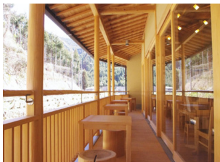
京都北山杉の里総合センター 北山丸太製品や市内産の一般材の使用例