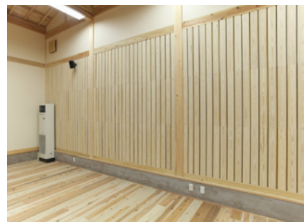
京都北山杉の里総合センター 壁：洛北（北山杉）