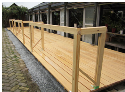
園芸店 ウッドデッキ：加工板（杉）