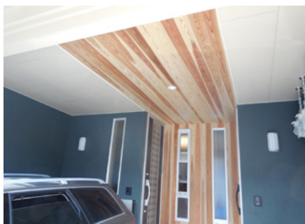
外壁と天井：加工板（杉）