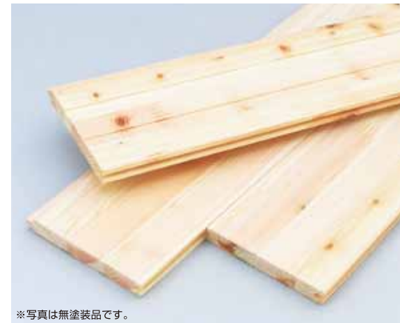
※写真は無塗装品です。