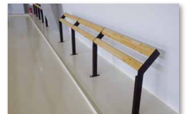
サポーターベンチ