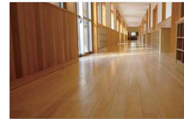
無垢材表層貼りフローリング