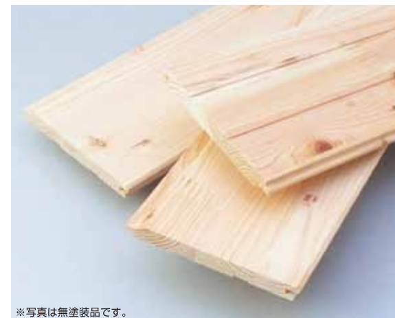
※写真は無塗装品です。