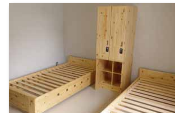
ベッド・ロッカー