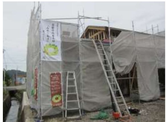
みやこ杉木利用 PR の例 施工現場にのぼり、啓発幕を掲示