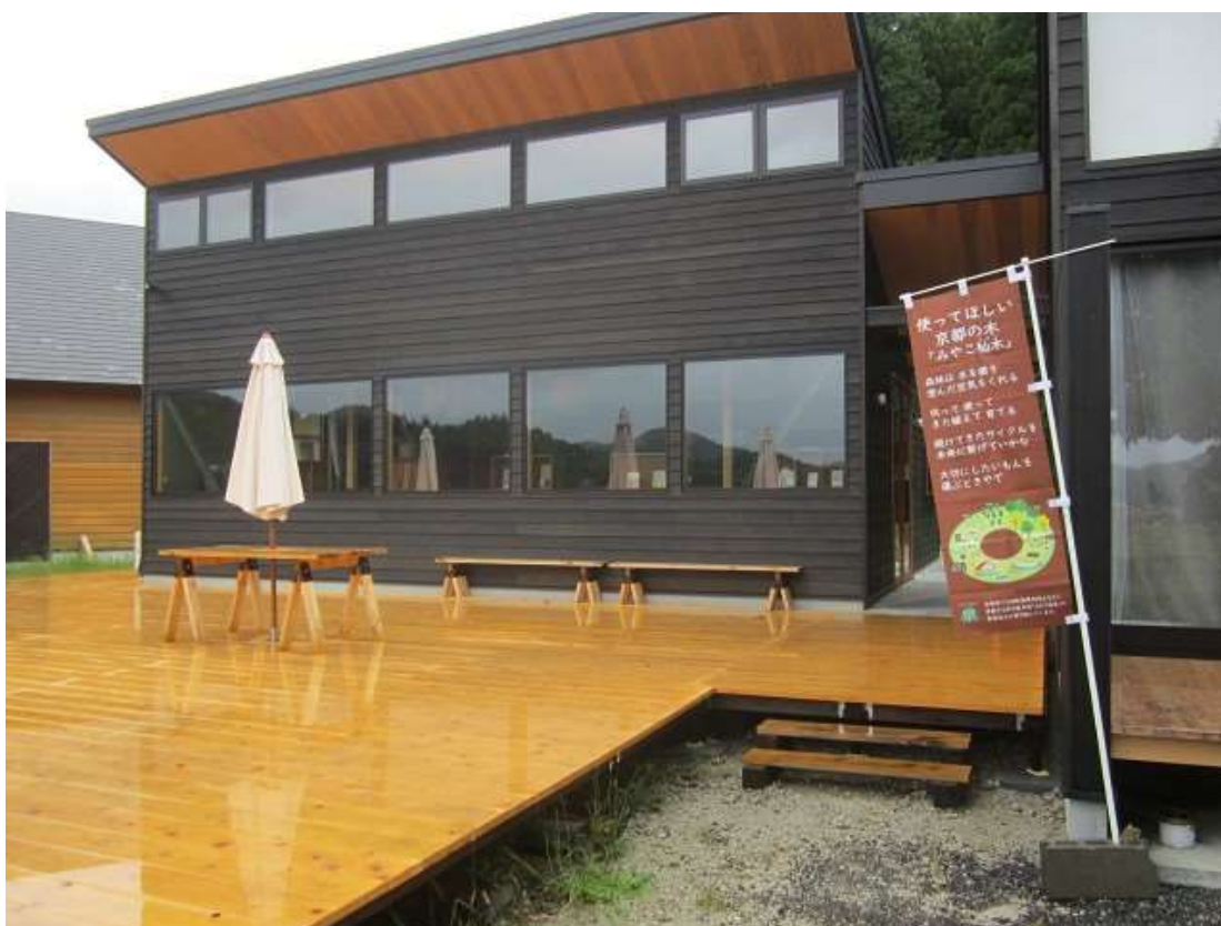
令和4年度の施工事例