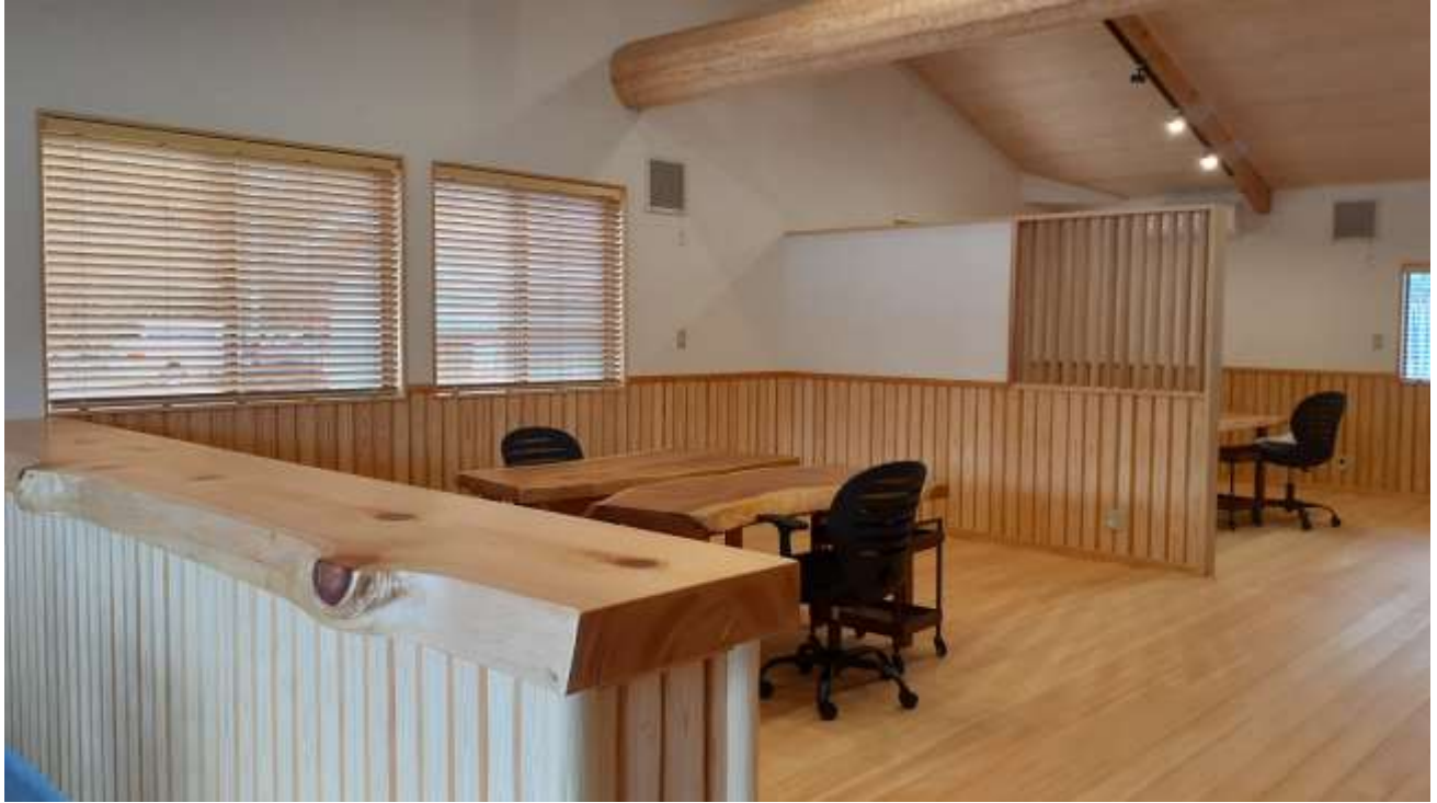
令和4年度の施工事例