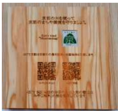
銘板で不特定多数の方々に PR