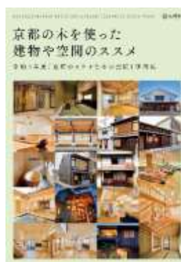
京都のステキな木の空間に応募して PR