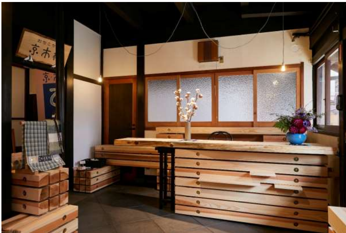
令和5年度の施工事例