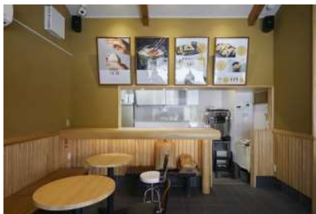
令和5年度の施工事例