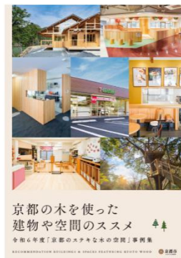
京都のステキな木の空間に応募して PR