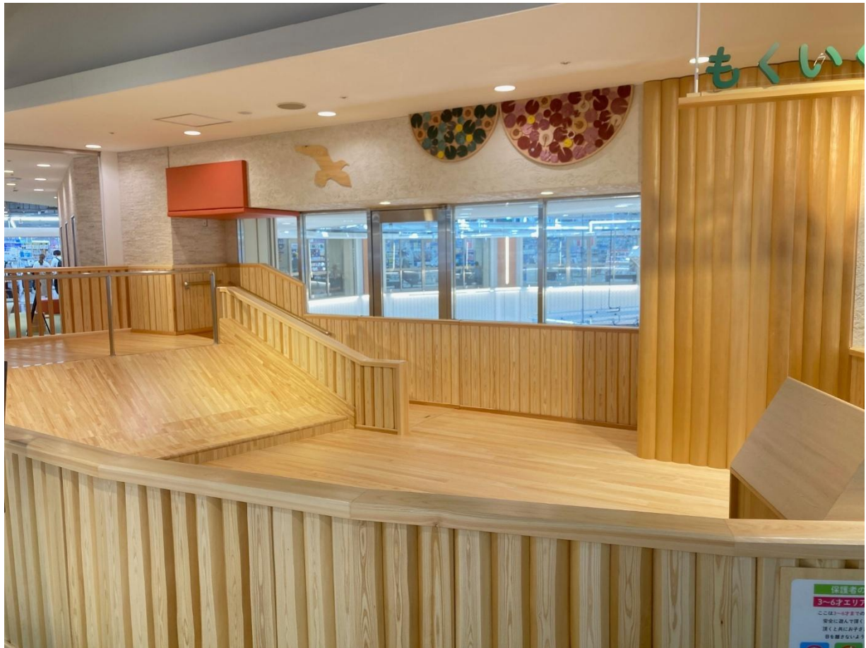
令和6年度の施工事例